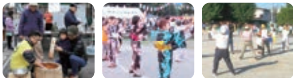
▲ 楽しさいっぱい！お祭りやレクリエーション活動

自治会は安全・安心なまちをつくっています。 住んでよかったと思えるまちを一緒に作りましょう。