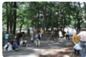
▲ まちがきれいだと気持ちいい！環境美化活動