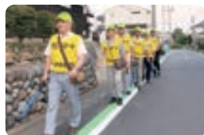
▲ 地域の安全のために！交通安全・防犯活動

このほかにも、自治会は、地域内の各種団体と協力して、さまざまな活動をしています。