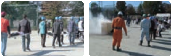
▲ 日頃の備えが大切！防災活動